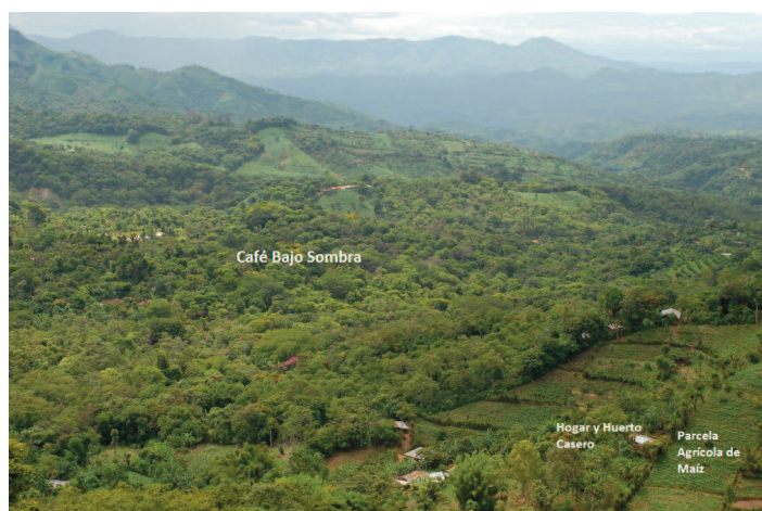
Figura 2. Vista del paisaje de la cooperativa ES2, incluyendo café bajo sombra, una parcela agrícola de maíz y un hogar con huerto casero aledaño, en Tacuba, El Salvador.

La diversidad de especies de cultivos agrícolas fue similar en ambos países, pero se observaron diferencias en los tipos de cultivos y el número de variedades. Las familias de Nicaragua manejaban trece variedades de maíz y nueve variedades de frijoles. En El Salvador el número de variedades de maíz fue menor (7), pero el número de variedades de frijol fue mayor (20; Tabla 2). El nú-