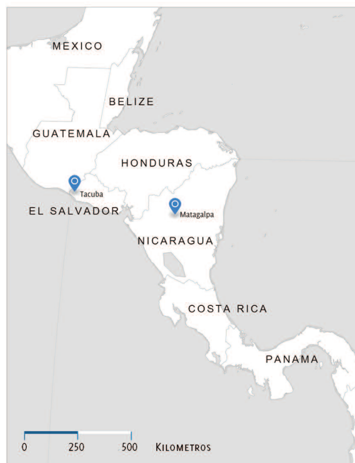
Figura 1. Ubicación de Tacuba, El Salvador y Matagalpa, Nicaragua.

Tanto en El Salvador como en Nicaragua el estudio se llevó a cabo en paisajes que incluyen áreas de café y otros cultivos, dentro de lo que puede calificarse como una matriz agroecológica (Perfecto y Vandermeer 2002), la cual rodea un área protegida de bosque (Fig. 1). En todos los casos trabajamos con agricultores que eran miembros de cooperativas y que cultivaban café como actividad agrícola y económica principal.