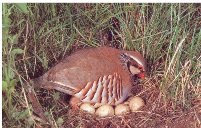
Figura 1. La perdiz roja tiene un peculiar sistema de reproducción basado en la doble puesta. Alrededor del 50 % de las hembras en años climatológicamente favorables ponen huevos en dos nidos, uno incubado por el macho y otro por ella misma (Casas et al. 2009). El éxito de eclosión es por tanto una variable particularmente importante en la demografía de esta especie.

Por último, teniendo en cuenta las circunstancias, no parece descabellado plantear la necesidad de revisar el status real oficial de esta especie, aunque se estén cazando millones de ejemplares al año.