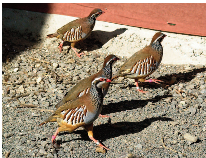
Figura 3. La suelta de perdices antes o durante la temporada de caza se ha convertido en una práctica habitual, con una industria detrás, ya que se liberan al menos 3-4 millones de perdices al año. Sin embargo, esta práctica no ha ayudado a la recuperación de las poblaciones silvestres, sino que se ha convertido en un problema añadido por contaminación genética, transmisión de parásitos y enfermedades, disminución del éxito reproductivo de las poblaciones que reciben las perdices soltadas y sobrecarga de ejemplares silvestres.