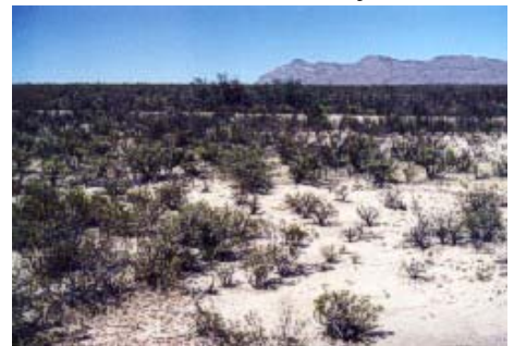
Foto 1. Desierto chihuahuense con presencia de Larrea tridentata .