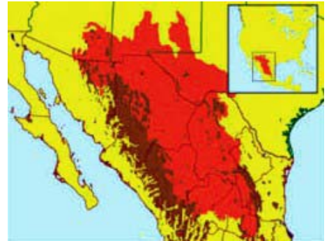
Figura 1. Localización del Desierto Chihuahuense, señalado en rojo.

Los Sistemas de Información Geográfica son un conjunto de herramientas para la colección, almacenamiento, recuperación, transformación, análisis y representación de datos espaciales (Burrough, 1986). Los sensores remotos y en general los sistemas de información geográfica facilitan información crítica para el estudio de los recursos naturales (Chuvieco, 1990). Los análisis de datos multi-temporales de satélite permiten identificar y evaluar aspectos de cobertura, uso de suelo, composición botánica, densidad y tipos de vegetación (Descroix y Moriaud 1995), Landa y col. 1995), Luna y Watts 1995). Así, Cervera (1995), al trabajar en el diseño de un Parque Ecológico en Nogales (Sonora, México), utilizó un SIG con diferencias de cotas de altitud de 1 metro para generar un Modelo Digital de Elevación del terreno que permitiera ubicar espacialmente las distintas características del parque.