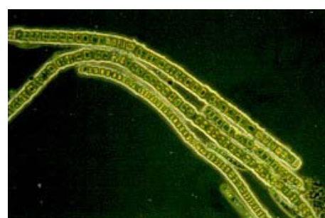
Foto 2. Detalle de cianobacterias.