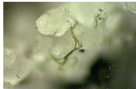
Foto 1. Detalle de algas microscópicas del sustrato arenoso del Matorral de Florida.

Las costras no se distribuyen de manera uniforme en el paisaje. Son extremadamente vulnerables al disturbio, incluyendo el fuego y el pisoteo, por lo que se pueden observar diferencias entre sitios debido a su historia de incendios y a diferencias resultantes de disturbios locales como senderos o veredas. Por ejemplo, después de un incendio, las algas y las cianobacterias requieren de 10 a 15 años para alcanzar su máxima abundancia en el Matorral de Florida (Hawkes y Flechtner 2002). La recuperación total del funcionamiento de la costra puede requerir entre 1 y 100 años dependiendo de su composición de especies, nivel de disturbio y distancia a la costra intacta más cercana (Anderson et al. 1982, Belnap 1993).