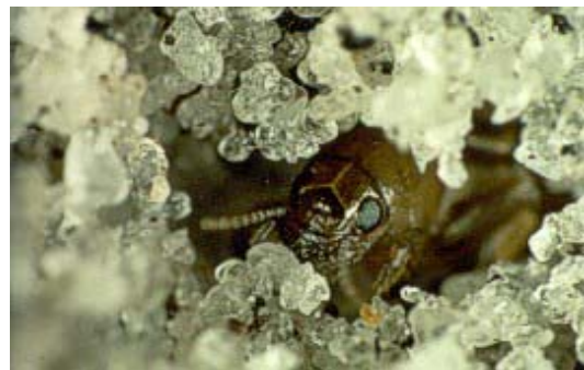
Foto 5. Un individuo de Neotridactylus archboldi en una madriguera excavada por él.