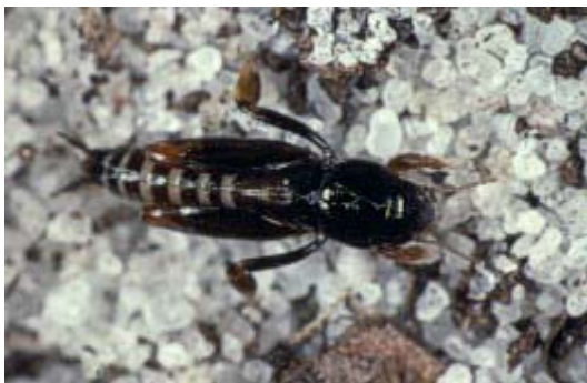
Foto 4. Neotridactylus archboldi .