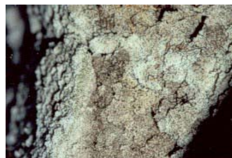
Foto 3. Detalle de una capa de cianobacterias en el suelo del Matorral de Florida.