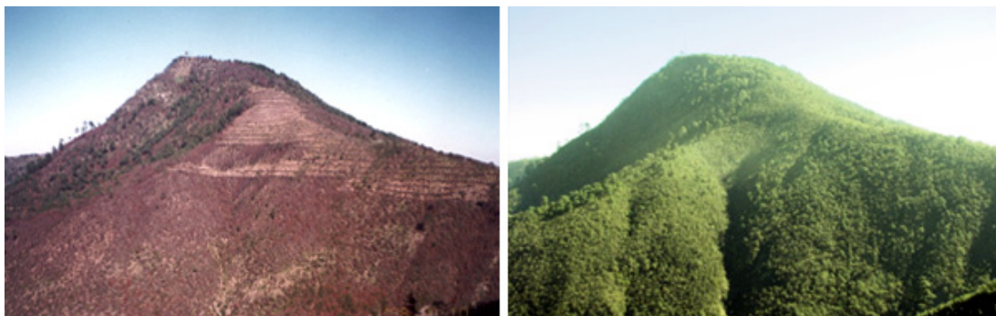
Figura 2. La fotografía izquierda (año 1998) muestra la zona afectada después del incendio en la que se aprecian las obras de retención del suelo. La foto de la derecha muestra el estado de la misma zona en 2009.

El programa de restauración consistió en: 1) implementación de obras de retención de suelo con material arbóreo incendiado siguiendo curvas de nivel ( fajinas , Fig. 2 ), 2) plantación de brinzales de P. pseudostrobus a una densidad de 2000 individuos/ha, con reposición de planta muerta durante 5 años (1999-2004), 3) eliminación de vegetación competidora de la plantación de P. pseudostrobus durante el periodo 1999-2003, y 4) poda de los vástagos de la base del tronco de Quercus sp., dejando únicamente el que presentaba las mejores características diamétricas ( resalveo ).