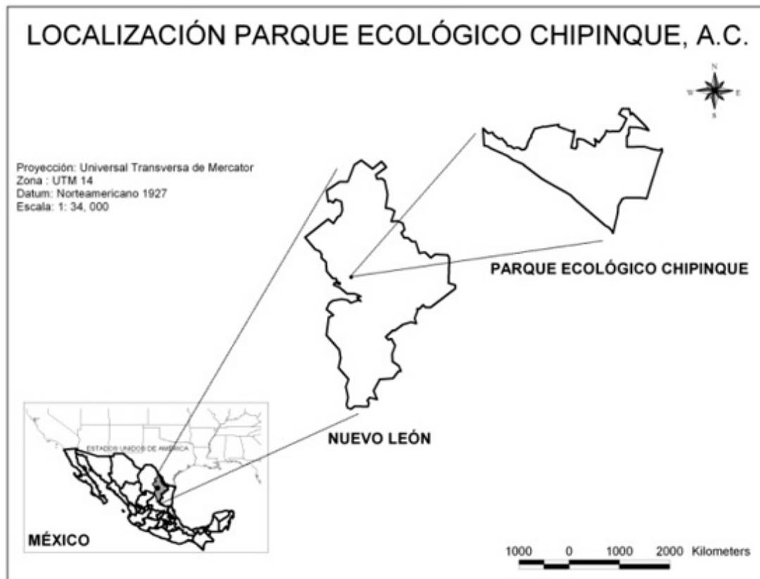
Figura 1. Localización del Parque Ecológico Chipinque.

En la zona incendiada se realizó un programa de restauración ecológica dejando un área como testigo de regeneración natural. La comunidad vegetal que se eligió como referencia para el proyecto fue la descrita por Jiménez et al. (2001), que se encontraba contigua al área incendiada, donde se registraron seis especies leñosas, una densidad arbórea de 340 individuos/ha y a Pinus pseudostrobus como la especie clave (183 individuos/ha).